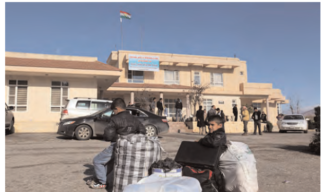
[Syrian Kurdish children with luggage wait to cross into Iraqi territory outside the Peshabur border gate at the Syrian-Iraq border, Feb. 2, 2013.]

When activists were trying to lobby with a petition in Arabic to put the PYD on the terrorist list — similar to other PKK affiliates — and the Syrian Revolution Facebook page tried to launch Friday protests on