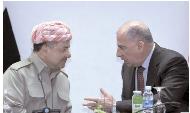
Iraq's Parliament Speaker Osama al-Nujaifi (R) meets with Iraqi Kurdish President Massoud Barzani (L) in Baghdad, July 7, 2013.

"I think that all steps taken by the president of the Kurdistan region are unresolved and not well considered, for if this was not the case, he would have consulted Kurdistan's citizens and made a speech. Yet a