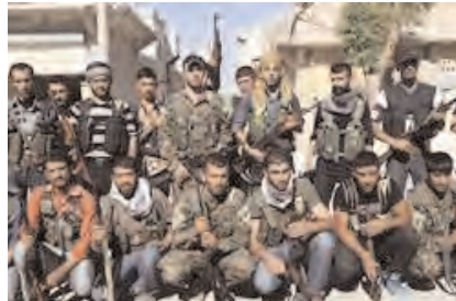
Kurdish YPG fighters

Just across the border, the Kurdistan Workers' Party (PKK) - proscribed as a terrorist group by Turkey, the US and others - has