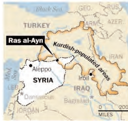
The Washington Post

Recep Tayyip Erdogan said Syria's Kurds should not try to set up an autonomous region, warning that "these steps they are taking are wrong and dangerous," Reuters news service reported.