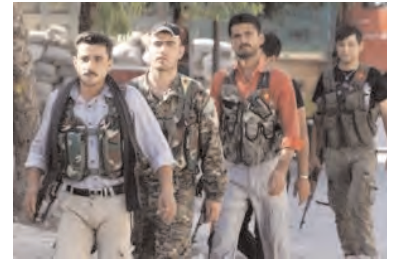
War within war

Kurds represent about 15 percent of the Syrian population. □