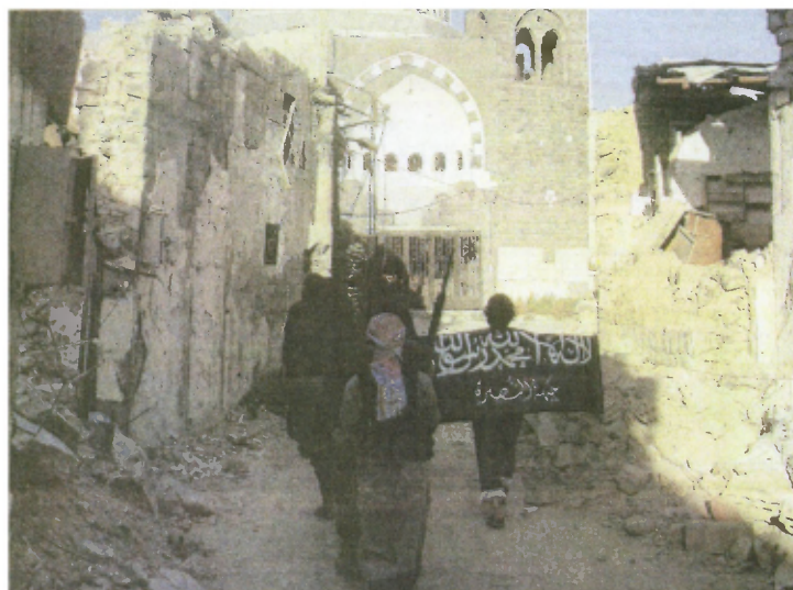
Des combattants de l'ASL, accompagnés d'hommes du Front Al-Nosra, patrouillent dans Homs, le 2 juillet.

A Alep, l'EIL a exécuté en public un adolescent de 15 ans, qui avait ironisé sur le nom du prophète Mahomet, suscitant un tollé. A Rakka, les hommes cagoulés de noir sont soupçonnés d'avoir enlevé le président du conseil municipal, Abdallah Khalil, un militant des droits de l'homme local qui