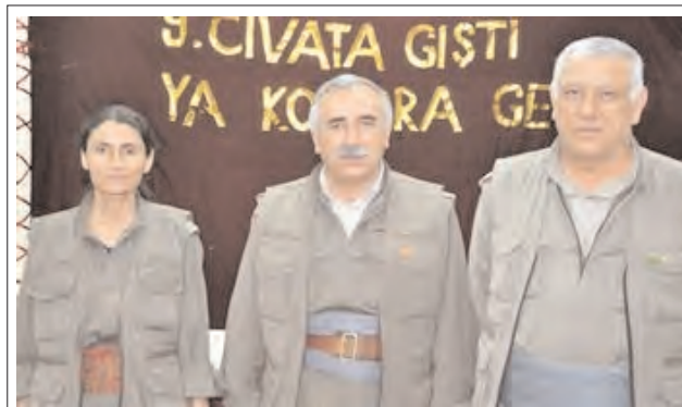
Murat Karayılan was appointed leader of the PKK's armed wing, the People's Defense Forces (HPG) after handing over the leadership of the organization to Cemil Bayık and Bese Hozat.

Karayılan said the PKK's jailed leader has proposed the establishment of eight commissions to facilitate the process. "In