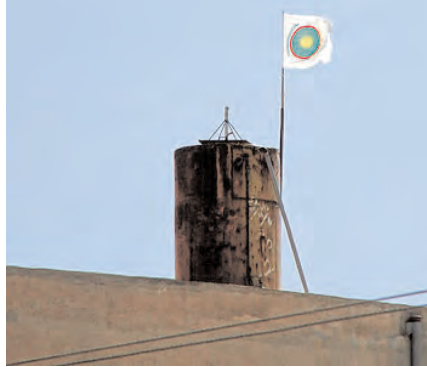
The Syrian Supreme Kurdish Council -- an umbrella organization that includes the Democratic Union Party (PYD) -- replaced the PYD's flag atop an abandoned factory in Ras al-Ain with its own on Friday.

The commander of the Popular Protection Units (YPG) in Syria, the military branch of the PYD, Sipan Hemo, whose forces have recently gained some Syrian districts in the country's north amid ongoing clashes with radical groups, said Turkey has nothing to fear from YPG forces, describing extremist groups