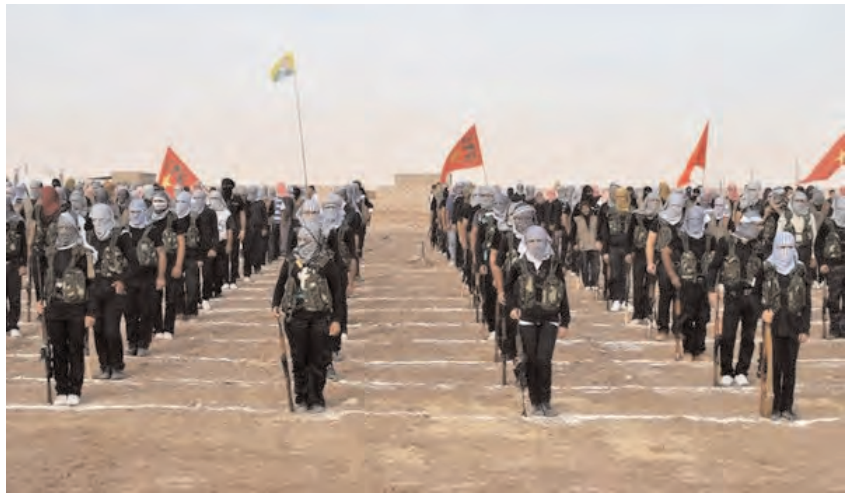
Kurdish opposition fighters at a ceremony last week in the northern Syrian border village of al Qamishli. At least 29 people have been killed in fighting between Kurdish and jihadist fighters in northern Syria in recent days, according to a human rights monitoring group. (July 18, 2013)

This week, Gen. Salim Idris, the ostensible head of the U.S.-backed Free Syrian Army, or FSA, is scheduled to visit the United States in a bid to pressure Washington to provide more arms to fighters affiliated with his umbrella faction, the Supreme Military Council. However, some U.S. lawmakers have balked at White House plans to arm the Syrian rebels, voicing fears that weapons could end up in the hands of anti-western militants with ties to Al Qaeda.