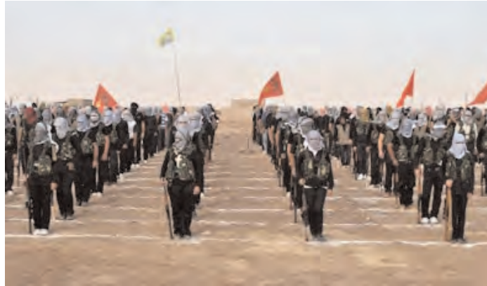
Une trentaine de combattants islamistes et kurdes ont été tués cette semaine, ce qui a abouti à l'expulsion des fondamentalistes de Qamishli, une ville frontalière avec la Turquie.

Ces accrochages surviennent en effet au moment où les tensions se sont exacerbées entre l'ASL – rebelles soutenus par des pays arabes et occidentaux – et le Front el-Nosra et l'État islamique en Irak et au Levant (EIIL), deux groupes affiliés à el-Qaëda qui combattent également le régime de Damas. D'ailleurs, ces combats surviennent alors que des responsables kurdes ont annoncé hier que les Kurdes de Syrie prévoient de créer un gouvernement autonome tem-