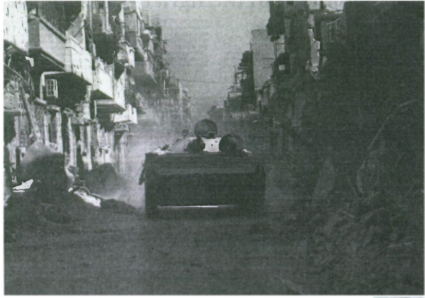
A Syrian Army armored vehicle in the city of Homs recently. In the last few days rebels have been killing each other, alienating the public and losing significant ground on the battlefield.

The fighting across Syria has Balkanized the country, with different areas controlled by competing groups. The government retains its grip on the capital and has increasingly reasserted itself across major population centers. Rebels have preserved their strongholds in the north, though they are far from a united force with competing militias setting up what amount to fiefdoms, imposing their own laws and at times attacking and