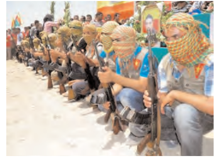
Miliciens kurdes de Syrie.

zones kurdes autonomes et cherchent à prendre le contrôle des installations pétrolières de Roumeïlan", a-t-il expliqué.