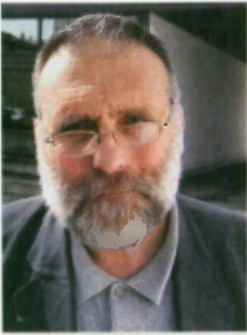
PAOLO DALL'OGLIO prêtre jésuite italien, refondateur dans les années 1980 du monastère catholique syriaque de Mar Mûsa (monastère de saint Moïse l'Abyssin), au nord de Damas; auteur de « la Rage et la Lumière », avec Eglantine Gabaix-Hiale, Editions de l'Atelier, 2013.

On me demande pourquoi les chrétiens devraient rester en Syrie. La question est plutôt celle-ci: restera-t-il encore des chrétiens en Syrie? Eux qui sont ici des autochtones, qui ont participé à la création d'une civilisation étonnante et fertile. Ils ont su vivre avec les juifs aussi au sein d'un Etat musulman. Ils ont été des partenaires actifs et enthousiastes. Le bon voisinage entre fils d'Abraham (le grand patriarche biblique père des juifs, des chrétiens et des musulmans) a une portée théologique et sociologique. Puis, par étapes, la chrétienté syrienne s'est restreinte et appauvrie. Et la crise actuelle risque d'en laisser seulement quelques vestiges ayant valeur de reliques. En général, les chrétiens n'ont pas pu se lancer massivement dans la révolution comme leurs concitoyens sunnites. Ils n'ont pas tous voulu non plus, Dieu merci, se ranger de manière compacte avec les Alaouites du côté du régime et de sa répression horrible. Ceux qui avaient déjà de la famille à l'étranger ont pris la voie de l'exil. Les plus pauvres restent et encourent les mêmes risques que les autres. Mais l'infiltration et la pénétration de groupes extrémistes sunnites radicaux clandestins (les mêmes que le régime des Assad avait envoyés en Irak après 2003) dans les rangs de la révolution a donné lieu à des attentats explicitement antichrétiens, comme en Irak, semant une terreur que les