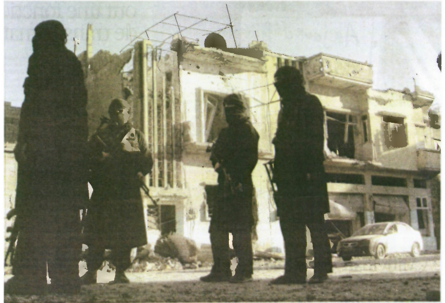
Des soldats de l'Armée syrienne libre accompagnés de combattants du Front al-Nusra (lié à Al-Qaeda), dans la vieille ville de Homs, le 2 juillet.

Les affrontements au sein de l'insurrection laissent augurer une fragmentation du pays.