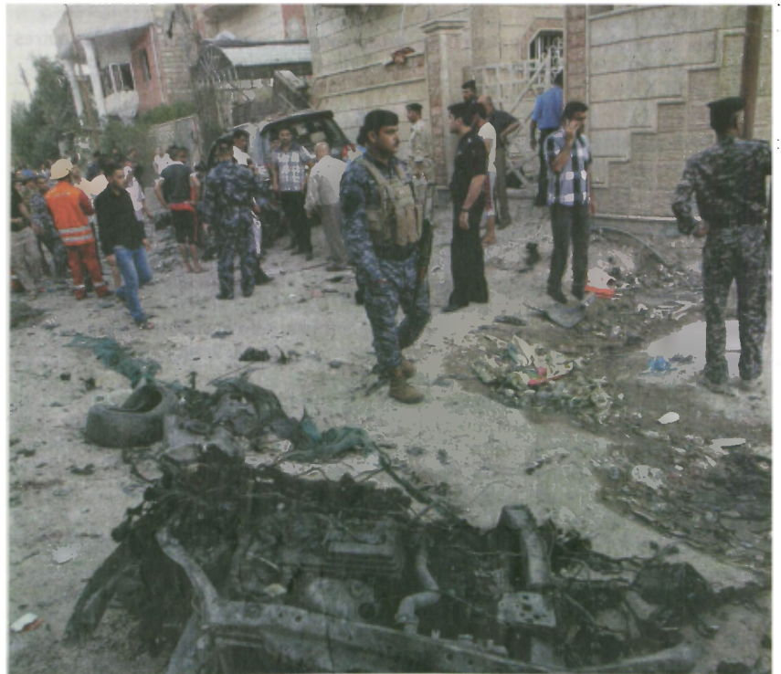
La police irakienne inspecte la scène d'un attentat à la bombe survenu, le 14 juillet, à Bassora, au sud-est de Bagdad, tuant 24 personnes.

570 personnes sont mortes en trois semaines à travers l'Irak