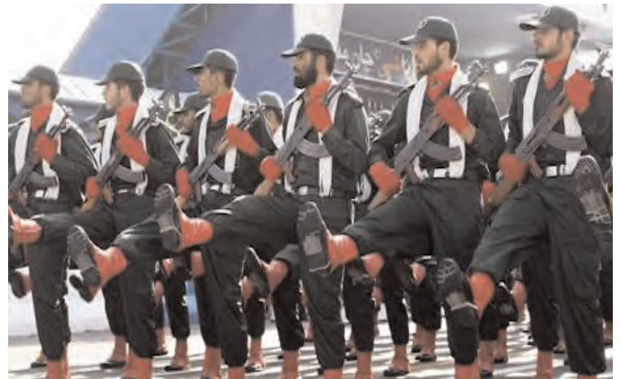
The paramilitary Revolutionary Guards – or Pasdaran -- claim that the intention behind this new force is to guarantee security and stability in the area.

"All the political parties in eastern (Iranian) Kurdistan are currently engaged in civil and political activities only," noted Brayim Zewayee, public relations officer of the Kurdistan