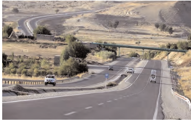
A brand new highway connecting the city of Sulaimani to the Dukan summer resort.

"Basically we make a new formed foundation for your road