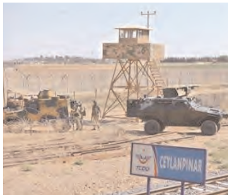
The YPG and al-Nusra are engaging in fighting close to the Turkish border town of Ceylanpinar.

Now, the PKK has been given a decisive chip on the negotiation table with the ruling Justice and Development Party (AKP), thanks to the march and rise of Kurdish militants in Syria. Regional Kurdish players, including the leader of Kurdish Regional Government (KRG) in northern Iraq, have tacitly admitted this growing PKK influence. In an anxious effort not to lose his self-proclaimed leadership of Kurds in the region, KRG leader Massoud Barzani has gathered a "national conference" and invited all Kurdish groups with different political backgrounds to Arbil