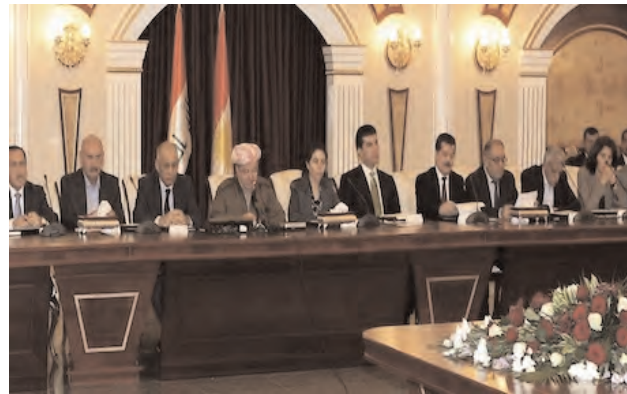
To set the conference agenda and procedure, Barzani met with representatives of 39 Kurdish political parties from across the Middle East on Monday.

Despite serious political disagreements between Kurdistan Region's opposition groups and Barzani's Kurdistan Democratic Party (KDP) over