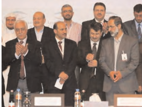
Le 6 juillet dans la capitale turque, après trois jours de houleuses délibérations, la CNS a nommé à sa tête Ahmad Assi Jarba, chef de tribu et opposant historique, réputé proche de l'Arabie Saoudite.

Conséquence de ces revirements, Ghassan Hitto, proche des Qataris et Premier ministre d'un gouvernement qu'il a échoué à former depuis quatre mois, a démissionné le 8 juillet. Autre indice de l'influence grandissante de Riyad, la chaîne saoudienne Al Arabiya, concurrente de la qatarie Al Jazeera, a célébré avec grandiloquence l'anniversaire de la création de la brigade rebelle Liwa al Tawhid, proche des Frères et jusque-là financée par le Qatar. A ce propos, certains observateurs sont persuadés que les hommes de cette brigade sont eux aussi passés du côté saoudien.