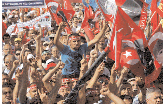
Les manifestations en Turquie se poursuivent malgré l'intervention de l'armée et la répression de la police.

Les fardeaux qui alourdissent le dos du premier ministre turc, Recep Tayyip Erdogan — confronté à la plus grave contestation populaire depuis le 31 mai — menacent fort son avenir politique. Longue est la liste de défis qui enveniment l'existence d'Erdogan. Après quelques jours de calme à Istanbul, plusieurs milliers de personnes ont de nouveau manifesté aux abords de la place Taksim, scandant des slogans : « Gouvernement démission ! » ou « Contre le fascisme ! ». Cette fois, les manifestations avaient un motif beaucoup plus dangereux : dénoncer l'intervention de l'armée vendredi contre plusieurs centaines de personnes qui protestaient contre l'agrandissement d'un camp militaire dans le sud-est du pays, faisant un mort et 8 blessés. Cet attentat, qui s'est produit dans une région fort critique — sud-est, à majorité kurde — a ressuscité la crise kurde qui était en voie de solution après l'accord conclu il y a quelques mois entre le pouvoir et le chef kurde emprisonné, Abdullah Ocalan. Pour dénoncer la répression de l'armée à leur égard, les Kurdes ont fondé dimanche un mouvement intitulé Gouvernement , prends une mesure, pour faire pression sur les autorités en vue d'obtenir des progrès dans le processus de paix avec eux. Dimanche, des milliers de Kurdes ont manifesté, alors que la police antiémeute a fait usage de gaz lacrymogène pour les disperser. Envenimant l'existence d'Erdogan, le Parti de la Paix et de la démocratie — pro-