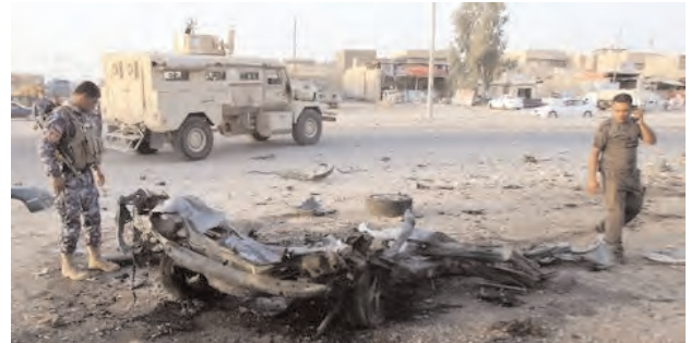
Des soldats se tiennent à côté de la carcasse d'une voiture, à Kirkouk, en Irak, le 11 juillet 2013

Le général Sabri Abed Issa se rendait dans une mosquée d'un village non loin de Charqat, au