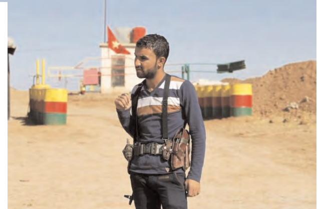
An officer of the Syrian Kurdish Democratic Union Party (PYD) stands guard near the Syrian-Iraq border