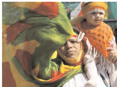
Une femme kurde et son enfant célèbrent la fête de Norouz, le 21 mars à Diyarbakir, en Turquie.

Ce prénom ne sera peut-être pas facile à porter en toutes circonstances. En revanche, il fera au moins la fierté de sa propriétaire dans sa région et dans les zones kurdes des pays voisins. En effet, elle est certainement la toute première à le porter; en Turquie, mais également en Syrie, en Irak et en Iran.