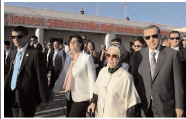
The airport in southeastern Şırnak has been named after the iconic Kurdish politician Şerafettin Elçi, who passed away last December.

Elçi is known for having broken a taboo on the Kurdish issue when he said,