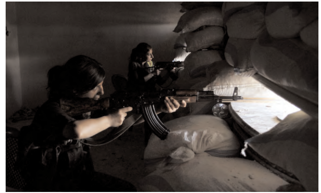
[Kurdish female fighters from the Popular Protection Units (YPG) take positions to guard the area in Aleppo's Sheikh Maqsoud neighborhood, June 19, 2013.]

There has been not a single casualty on either the Turkish or the Kurdish side since the peace process was officially announced in January. The lull in violence has emboldened Kurds to expand their political activities. Its return would not only alienate their own supporters (and the same holds true for the government), it would unravel the