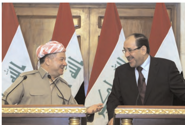
Le président du Kurdistan irakien, Massoud Barzani, et le Premier ministre de l'Irak, Nouri al-Maliki, en conférence de presse dimanche à Bagdad.

En mai, les ministres et députés kurdes irakiens avaient mis fin à un boycottage du gouvernement central et du Parlement, entamé