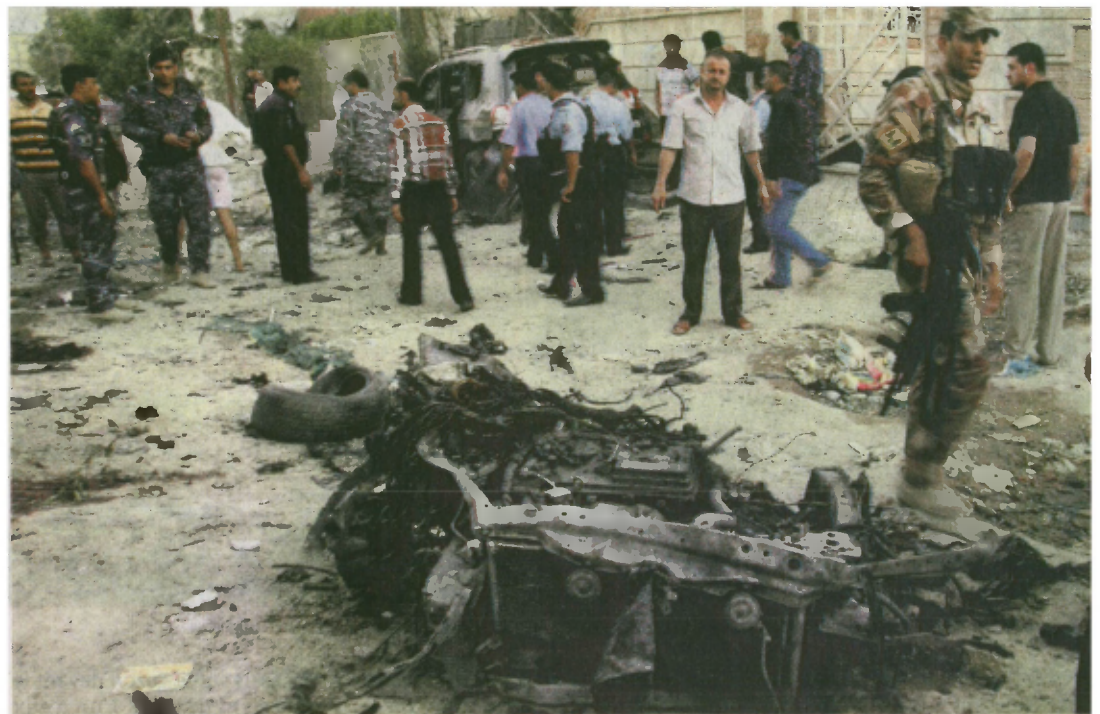
Un attentat à Basra, à 550 km au sud de Bagdad, le 14 juillet.