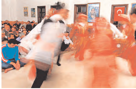
A group of Alevis are seen performing a sema, an Alevi ritual characterized by turning and swirling, in a cemevi.

Another hot item on the Turkish agenda is the right to receive an education in one's mother tongue, which is a key issue for the Kurdish people. The MetroPOLL survey reveals that the Turkish public has warmed to the idea. When asked whether people should be able to receive an education in the Kurdish language in predominantly Kurdish-populated areas, 48.2 percent of survey participants responded favorably, while 47.9 percent responded nega-