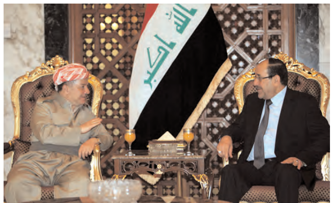
[Iraqi Prime Minister Nouri al-Maliki (R) meets with Iraqi Kurdish President Massoud Barzani (L) in Baghdad, July 7, 2013.]

The most prominent question today is: Did Iraqi leaders understand