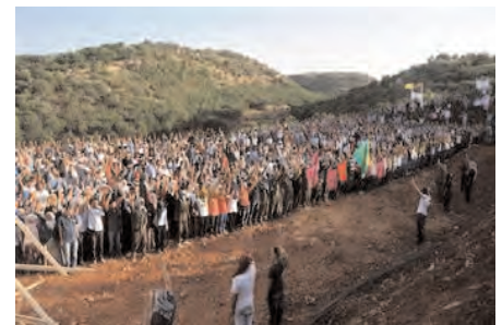
Around 5,000 people, including Peace and Democracy Party (BDP) members and around 15 PKK militants, who covered their faces with kaffiyeh, attended the opening of the cemetery where around 170 PKK militants are buried.

BDP Diyarbakır deputy Nursel Aydoğan and provincial head Zübeyde Zümrüt as well as many other party members were present at the opening. Posters of some PKK members who died during clashes as well as a poster of Abdullah Öcalan, the convicted PKK leader imprisoned for life, were present. An unidentified